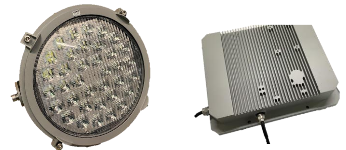
Stella LED 470W

Stella LED -sarja on suunniteltu kestäväksi vaihtoehdoksi. Valaisimessa on pulverimaalattu alumiinirakenne, karkaistu lasilinssi sekä vaihdettava LED-moduuli ja liitännälaite. Arvioitu käyttöikä on yli 30 vuotta.